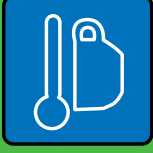
Gemeinsam Essen & Trinken