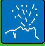
Anhusten & Anniesen