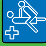
Arzt & Krankenpflege

RISIKO • GEFAHR • RISIKO • RISIKO • GEFAHR • RISIKO • RISIKO • GEFAHR • RISIKO • RISIKO • GEFAHR... ...bei • Blut • Sperma • Scheidenflüssigkeit • Muttermilch