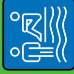
Bad & Sauna