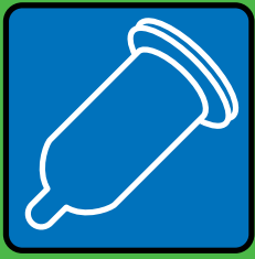
Sex mit Kondom