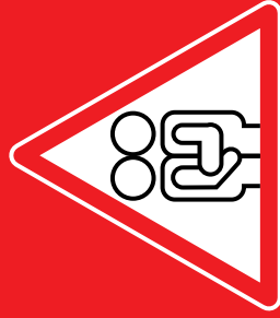
Sex ohne Kondom

RISIKO • GEFAHR • RISIKO • RISIKO • GEFAHR • RISIKO • RISIKO • GEFAHR • RISIKO • RISIKO • GEFAHR... ...bei • Blut • Sperma • Scheidenflüssigkeit • Muttermilch